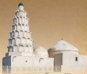
مزار مبارک حسن بصری رضی اللہ عنہ