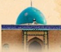
مزار مبارک سید احمد کبیر وفاقی رضی اللہ عنہ