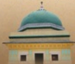
مزار مبارک شیخ عبدالحق محمد ثانی دہلوی رضی اللہ عنہ