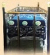
مزار مبارک حضرت بشر حالی رضی اللہ عنہ