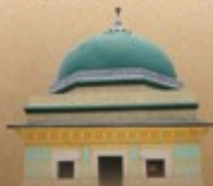
مزار مبارڪ شيخ عبدالمنن محدث دهلوي، ڪراچي