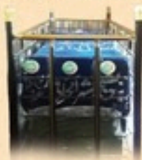
مزار مبارڪ حضرت پير حقيقي، ڪراچي