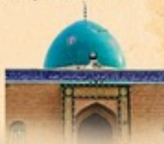
مزار مبارڪ سيد احمد كبير رقيقي، ڪراچي